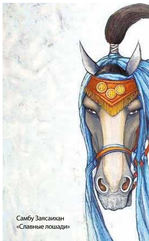
Самбу Заясаихан «Славные лошади»

Современная наука насчитывает девять вариантов монгольских языков. Это связано с завоеваниями Чингисхана, который в местах стоянок войска создавал княжества. Монгольские языки богаты на зооморфные конструкции,